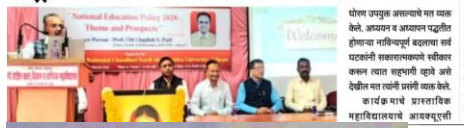
शोध समुह अकार्याचे वा कला केले. अकार्य व अकार्य पध्दतीत होणाऱ्या नावीन्यपूर्ण बदलाचा सर्व घटकांनी सकरात्मकपणे स्वीकार करून त्यात सहभाग घ्यावे असे देखील मत त्यांनी व्यक्त केले. कार्यक्रम मागे प्रशासक महाराष्ट्राबरोबर आयक्यूएसी