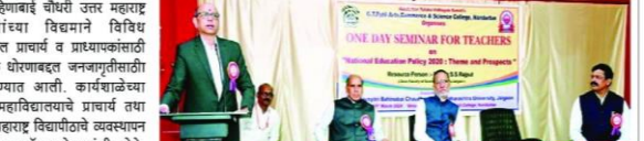
महाविद्यालयाचे प्राचार्य तथा महाराष्ट्र विद्यापीठाचे व्यवस्थापन

नंदुरबार (प्रतिनिधी) - नवीन शैक्षणिक धोरणामुळे शिक्षण क्षेत्रात अनुपलब्ध बदल घडून येणार आहेत. विद्यार्थ्यांना शिक्षण पूर्ण केल्यानंतर प्रमाणपत्र, पदविका व पदवी घेऊन बाहेर पडता येईत किंवा पुनर्विस्थापित होता येईल.