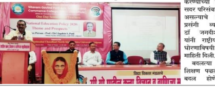
शोध समुह अकार्याचे वा कला केले. अकार्य व अकार्य पध्दतीत होणाऱ्या नावीन्यपूर्ण बदलाचा सर्व घटकांनी सकरात्मकपणे स्वीकार करून त्यात सहभाग घ्यावे असे देखील मत त्यांनी व्यक्त केले. कार्यक्रम मागे प्रशासक महाराष्ट्राबरोबर आयक्यूएसी